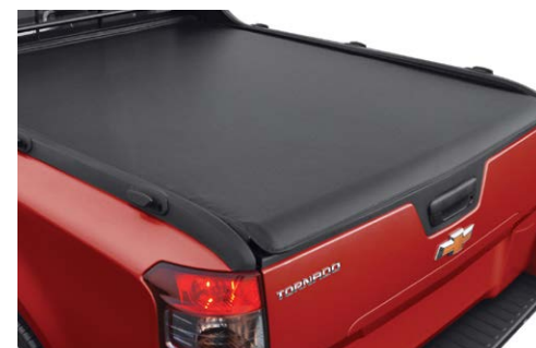
Cubierta suave para caja

Haz de tu Chevrolet Tornado® 2020 tu mejor aliada de acuerdo a tus necesidades y personalízala con distintos accesorios. Pregunta a tu Distribuidor Autorizado Chevrolet.